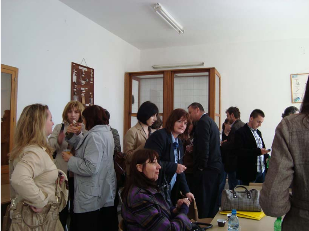
Razmijena mišljenja u vrijeme kafe-pauze