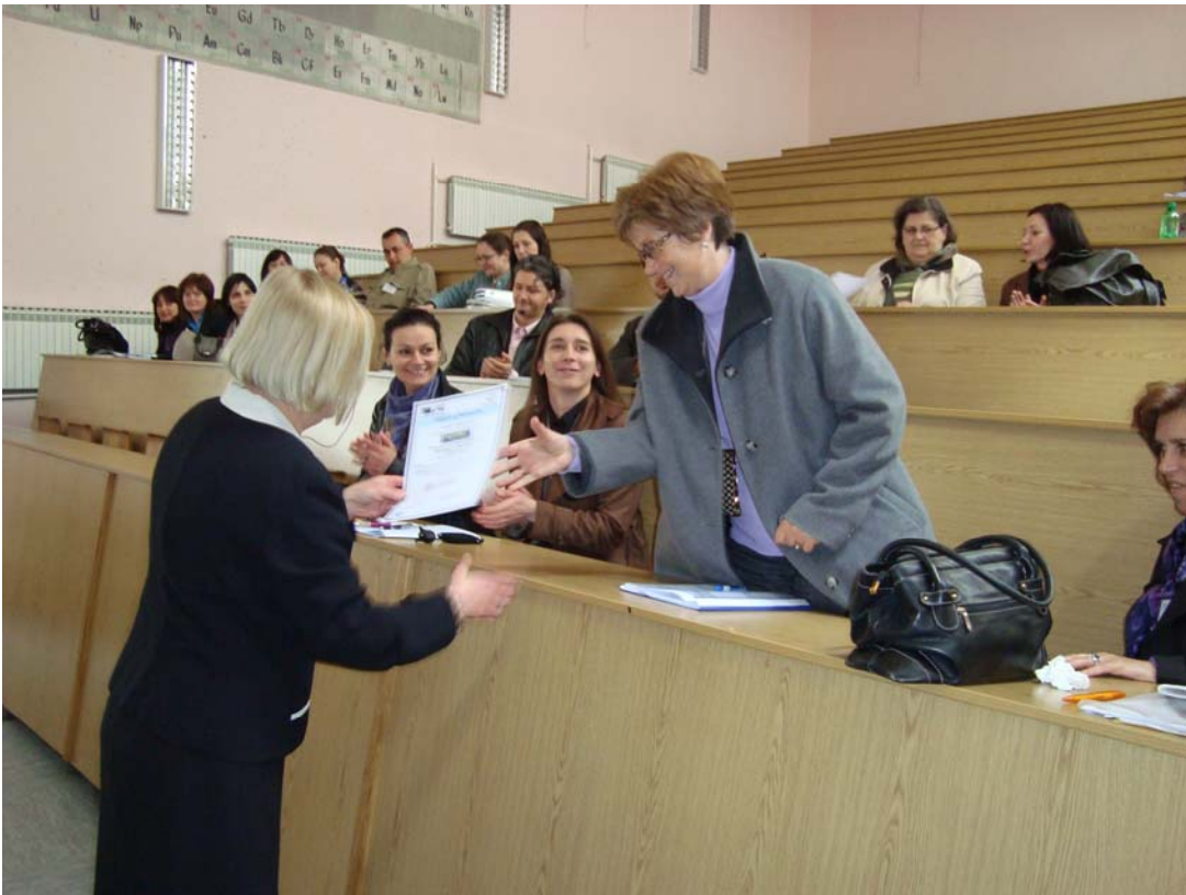
Podjela certifikata predavačima