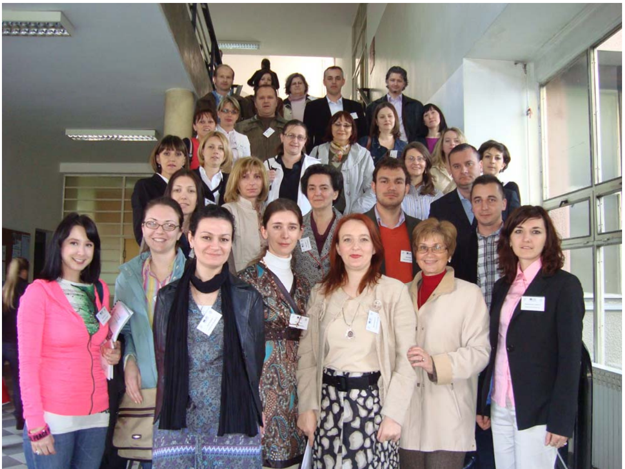
Zajednička fotografija učesnika

Dio atmosfere tokom edukacije prenosimo Vam preko fotografija kako slijedi: