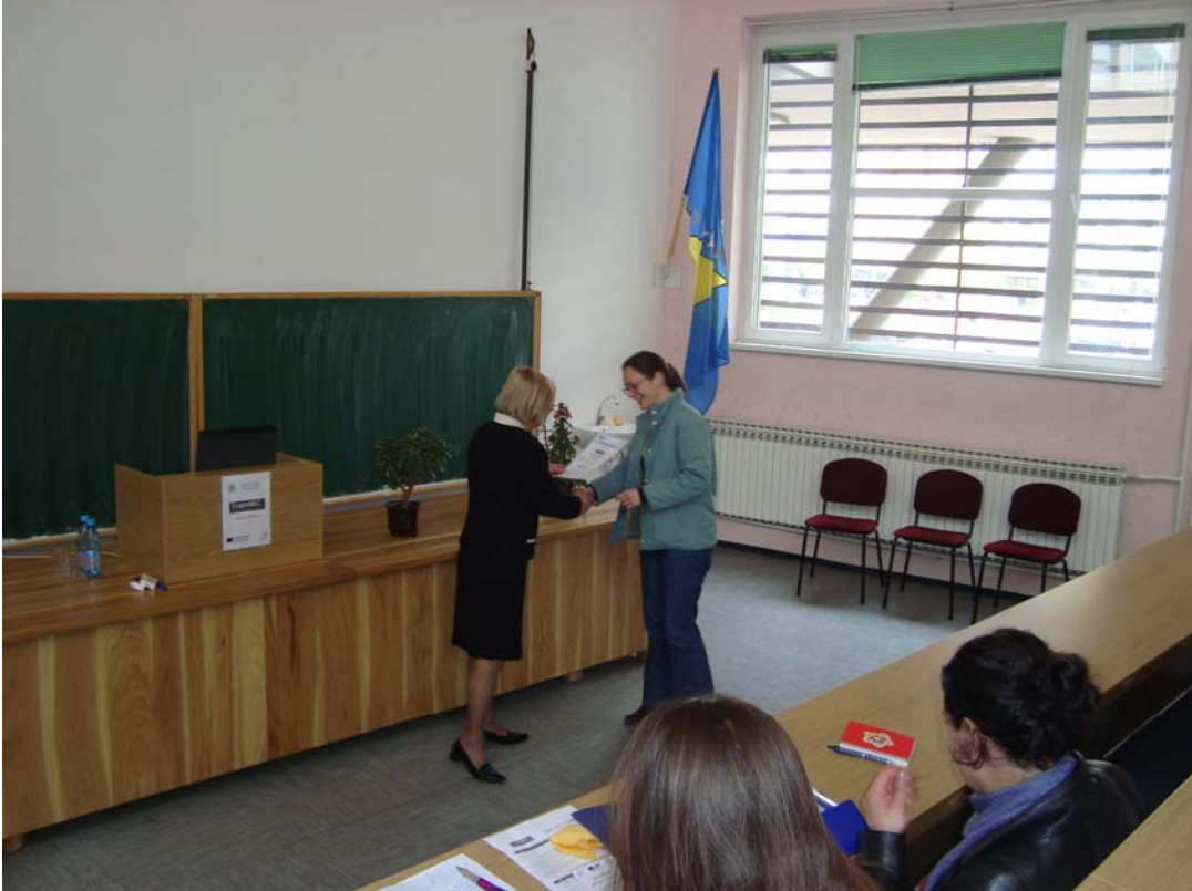
Podjela certifikata o učešću