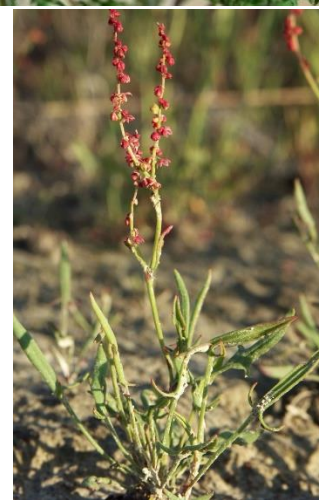
% udio polena alergernih biljaka